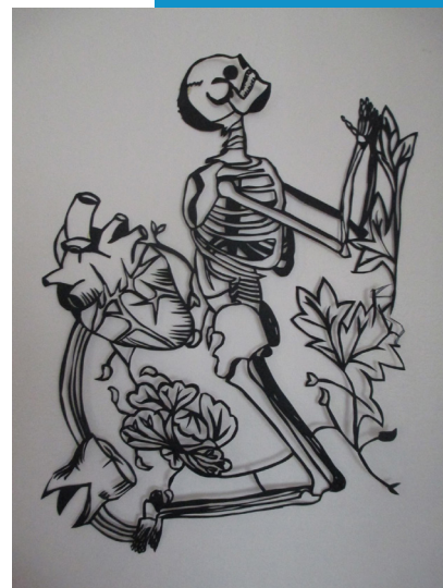
Oeuvre de Simone Découpe

Par l'Orchestre d'harmonie municipale de Baume les Dames Orchestre invité en deuxième partie : orchestre des jeunes du conservatoire de musique de Besançon Centre d'Affaires et de Rencontres, 16h30 Tarifs : 5€ / gratuit pour les moins de 16 ans